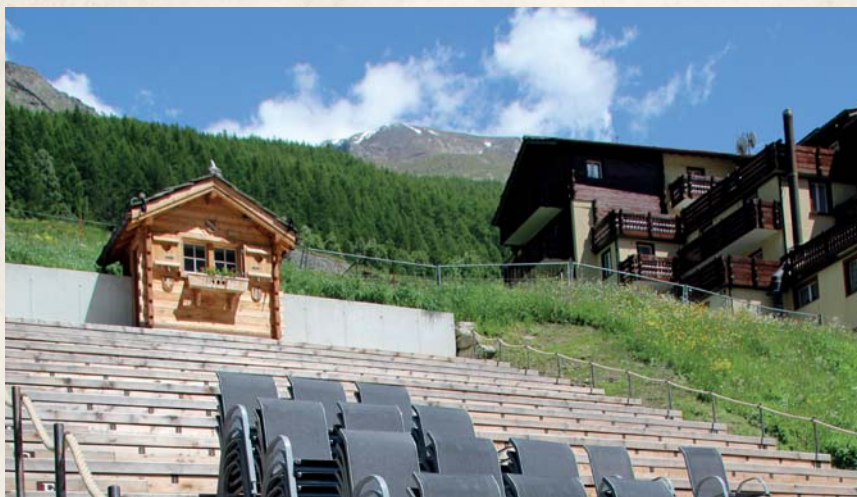
Geniessen Sie auf der Kulturbühne im alten Ortskern von Saas-Grund hochkarätiges Kabarett, umgeben von 13 Viertausendern.

Kulturbühne Saas-Grund lädt am 30. und 31. August 2018 zum Tränen Lachen ein.