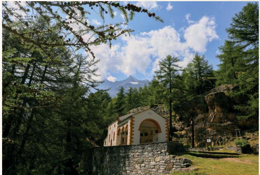
Der Kapellenweg, der sich zwischen Saas-Grund und Saas-Fee den Weg hochschlingelt, bietet beides: Natur und Kultur. 15 Kapellen säumen den Weg, die zwischen 1708 und 1711 erbaut wurden. Dieser Weg lässt sich in diverse Rundtouren integrieren.