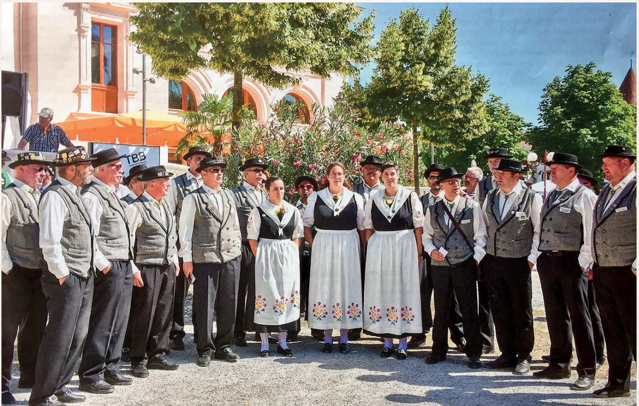
Der Jodlerklub Gletscherecho aus Saas-Fee ist an vielen Events zugegen, so wie auch hier am diesjährigen Westschweizer Jodlerfest in Yverdon.

Freunde der Jodlermusik können sich bereits am 26. August 2018 wieder auf einen klangvollen Auftritt vom Gletscherecho beim kantonalen Jodlertreffen in Lalden freuen. Und am 6. September 2018 gibt der Klub das nächste Sommerkonzert in Saas-Fee. Wir wünschen dem Jodlerklub Gletscherecho noch viel Erfolg auf ihrem bereits sehr erfolgreichen Weg in den letzten 35 Jahren.