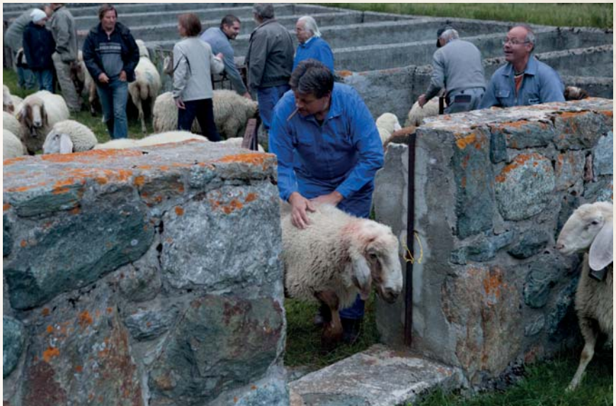
Der Alpaufenthalt ist eine Art Sommercamp für die Saaser Mutten, bei dem mehrere Züchter ihre Tiere zusammen grasen lassen. Im Herbst kehren die Tiere zurück ins Tal und werden in Gehegen nach Besitzern getrennt, bevor es zurück in den heimatischen Stall geht.

Ebenfalls am 15. September kommt ab 16 Uhr ein zweite Gruppe Saaser Mutten auf dem Saas-Grunder Scheidplatz beim Camping Michabel zur Aussortierung nach Besitzern zusammen. Für Schäfer und Interessierte gibt es hier eine kleine Kantine mit Bratwurst und Getränken.