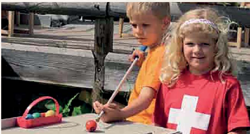
Pit-Pat, der Mix zwischen Minigolf und Billard, begeistert Jung und Alt. Am 8./9. September 2018 findet in Saas-Almagell die Schweizermeisterschaft statt, an der auch spontan Feriengäste und Einheimische teilnehmen können.

Ob Sonne oder Regen, die Pit-Pat-Spieler trotzten dem Wetter. Getreu dem Motto «Es gibt kein Schlechtwetter – nur schlechte Turnierkleider» wird die Schweizer Meisterschaft bei jeder Witterung auf der Pit-Pat-Anlage in Saas-Almagell durchgeführt. Der Samstag, 8. September 2018, gilt dem Einzelturnier. Die Vorrunden werden in Gruppenspielen ausgetragen.