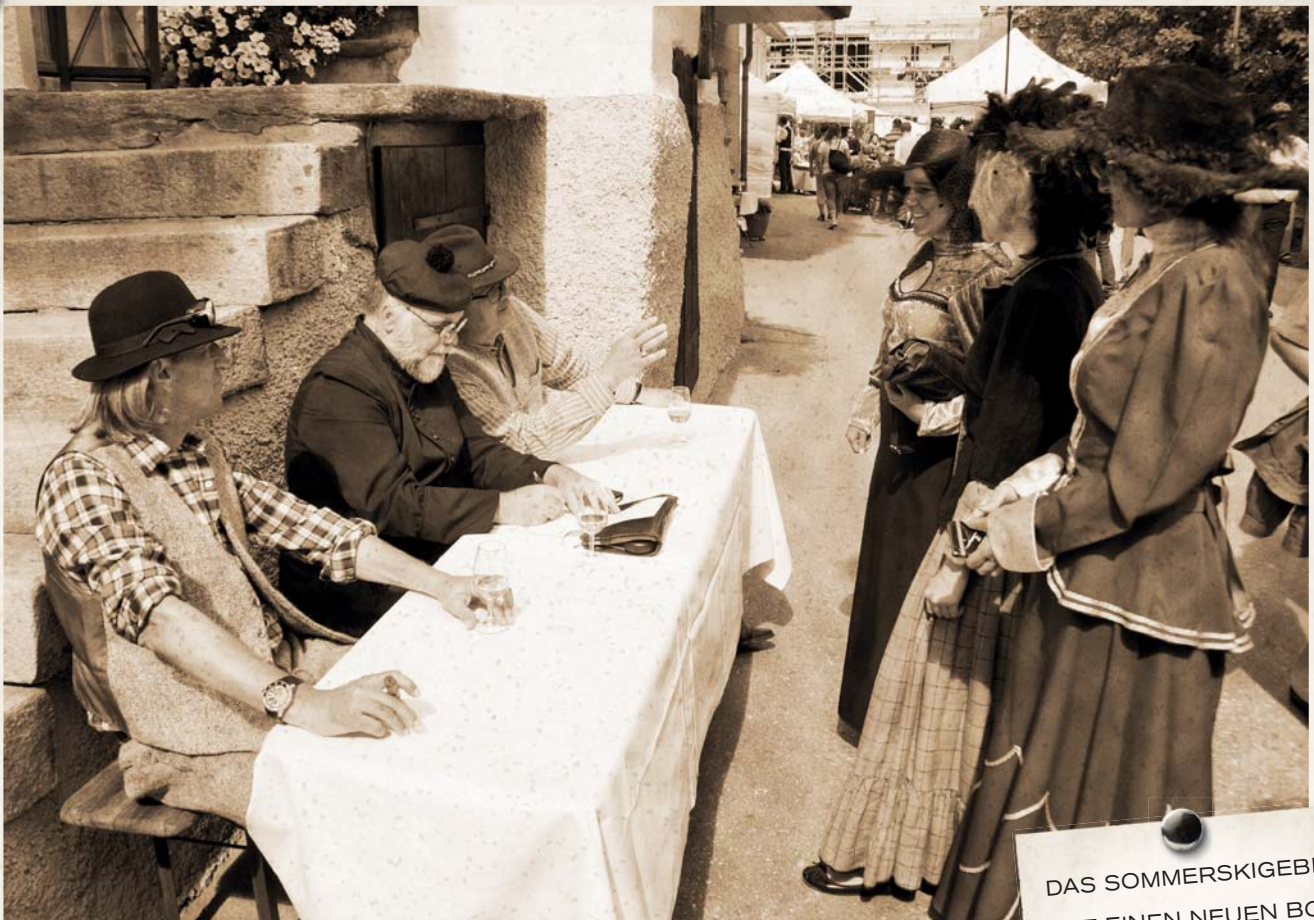
An der 13. Nostalgischen Genussmeile vom 9. September 2018 wird die Zeit in Saas-Fee um Jahrzehnte zurückgedreht. Geniessen Sie an diesem Event auf der Oberen Dorfstrasse fast schon in Vergessenheit geratene kulinarische Köstlichkeiten aus alten Zeiten. Mehr auf Seite 15.

Nr. 13 | 24. August bis 6. September 2018