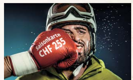
Skifahren zum Super-Spartarif, das gibt es nur im Saastal!

Dank dem Live-Ticker, den Sie über die Adresse make-it-happen-again.ch aufrufen können, kann die Anzahl registrierter Personen laufend mitverfolgt werden. Beim erneuten Zustandekommen der Aktion werden am 31. Oktober 2018 alle Crowdfunding-Teilnehmer per Email benachrichtigt und sind dann im Besitz einer WinterCARD zum Spartarif, die vom 1. November 2018 bis 28. April 2019 gültig ist.