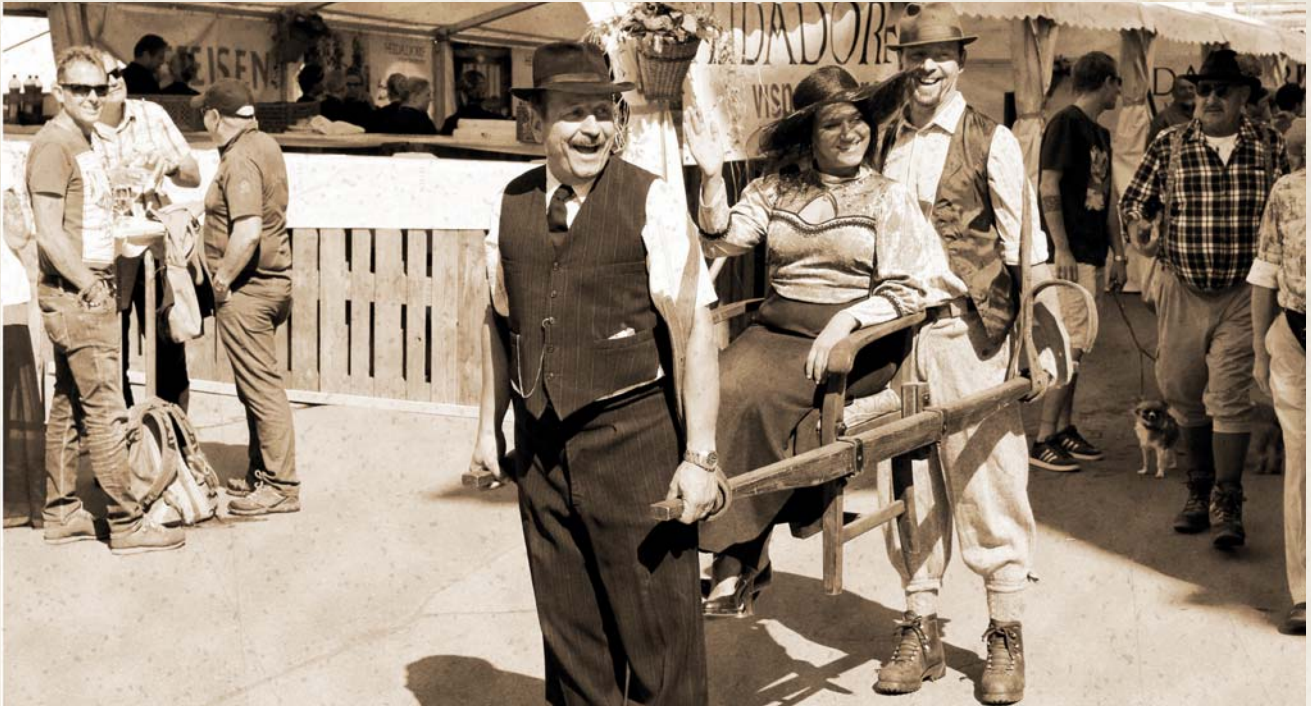
Geniessen Sie an der Nostalgischen Genussmeile lokale Spezialitäten von Anno dazumal. Wenn Sie mögen, kleiden Sie sich gleich auch selber wie in der guten alten Zeit.

Am 9. September 2018 wird die Zeit in Saas-Fee zum 13. Mal zurückgedreht.