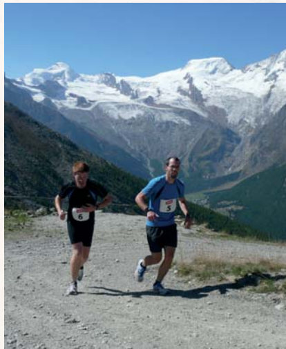
Geniessen Sie am Hohsaas-Berglauf die Landschaft!

Der 14,5 Kilometer lange Hohsaas Top-Run für besonders trainierte Athleten wurde für dieses Jahr gestrichen.