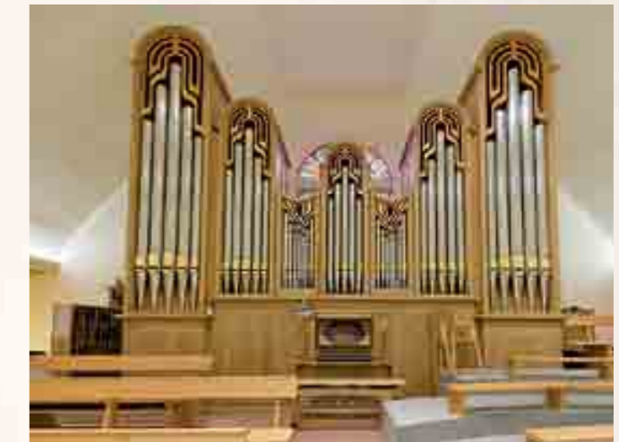
Die Orgel der Pfarrkirche St. Bartholomäus in Saas-Grund.