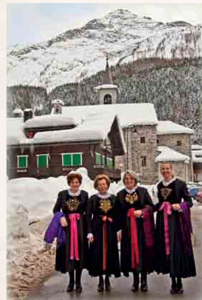
Brachte einheimisches Brauchtum an die Generalversammlung: die Delegation des Trachtenvereins Macugnaga.