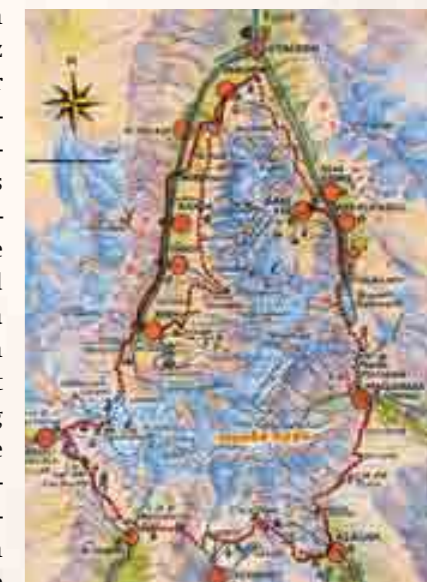
Anspruchsvolle Mehrtagestour für erfahrene und trainierte Berggänger: Die Tour Monte Rosa Matterhorn.

Die Tour Monte Rosa Matterhorn gilt als Traumwanderung unter den Mehrtages-Wanderungen im Alpenraum. Sie ist in neun Etappen aufgeteilt. Start und Ziel ist der Weltkurort Zermatt. Die Tour geht über den Theodulpass nach Italien, über den Monte-Moro zurück in die Schweiz nach Saas-Fee und von dort über Grächen wieder nach Zermatt. Diese Tour rund um das Monte Rosa-Massiv gehört zum Schönsten, was man als Bergwanderer im Alpenraum unternehmen kann. Einzige Voraussetzungen: Kondition und Ausdauer. Da die Tour Monte Rosa zu einer der anspruchsvollsten Wanderungen Europas zählt, ist eine entsprechende Ausrüstung notwendig. Zudem sollten einzelne Etappen von unerfahrenen Berggängern unbedingt nur in Begleitung von Bergführern begangen werden. Die beste Jahreszeit ist je nach Witterung von Mai bis September.