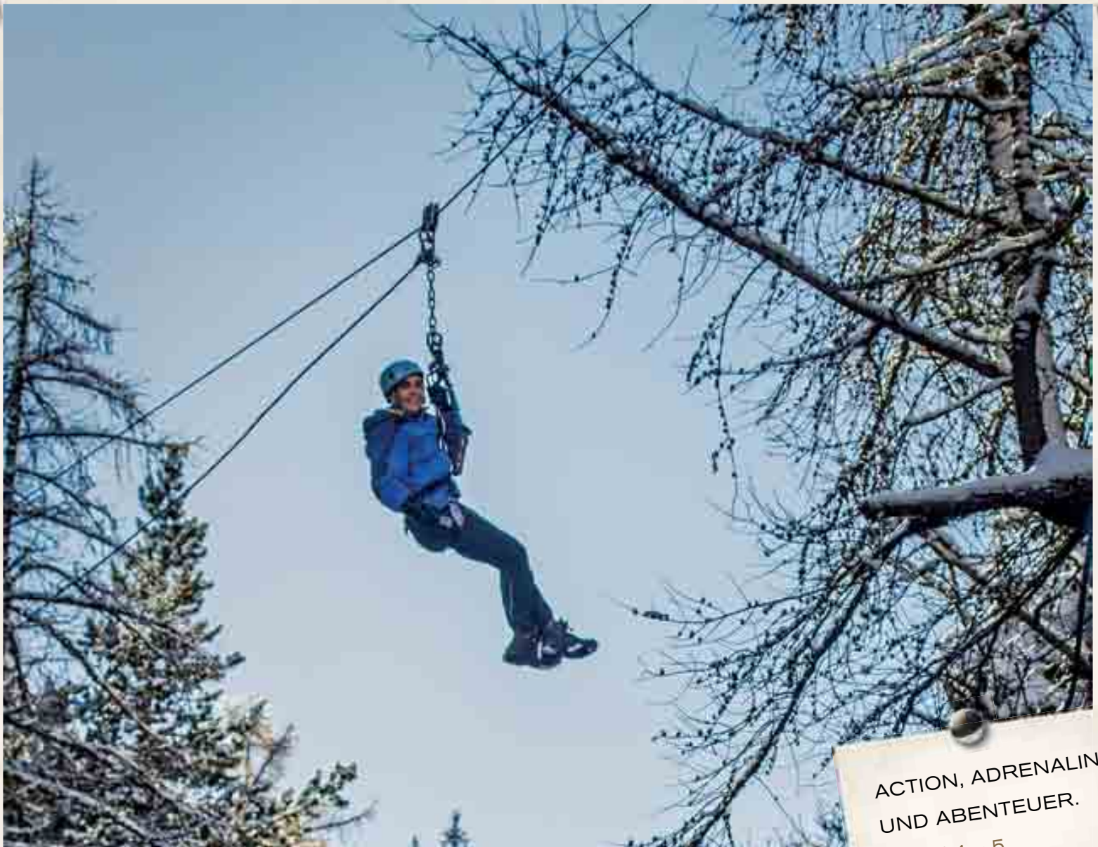
Die Gorge Alpine, ein einzigartiges Erlebnis mit bleibender Erinnerung – auch im Winter.