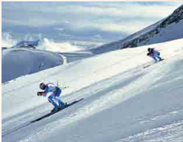
Die bekannte Volksabfahrt wird in verschiedenen Kategorien – wie das Sie- und Er-Rennen auf unserem Bild – durchgeführt.

Tipp: Haben Sie gewusst, dass Renn-Teilnehmer in der Woche rund