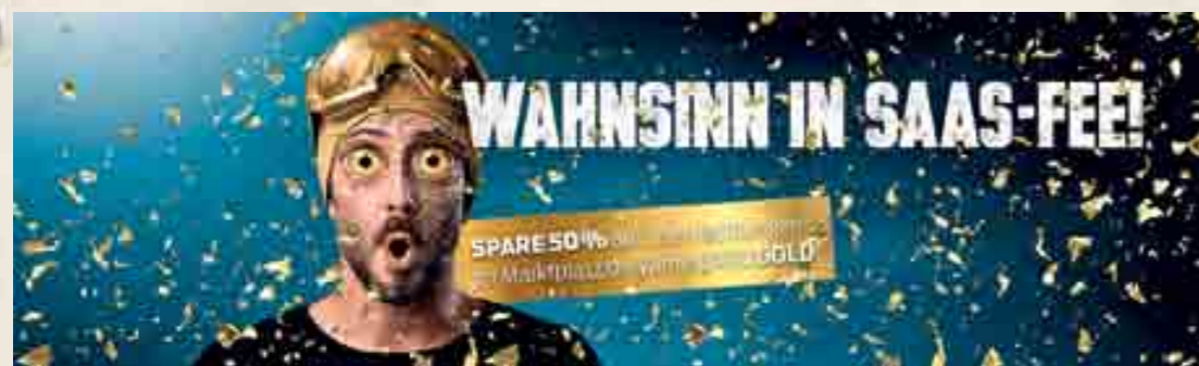
Da staunt man: Wahnsinnsangebote locken.

Anmeldung: www.allalin-rennen.ch Infos: Rennbüro Allalin-Rennen, 3906 Saas-Fee Tel. 027 958 11 33, allalin-rennen@saas-fee.ch