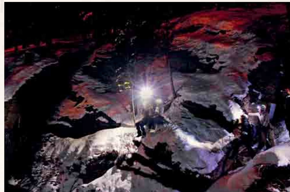
Die Gorge Alpine in der Nacht: Ein atemberaubendes Abenteuer der besonderen Art!

Die Feeschlucht kann ja das ganze Jahr begangen werden. Weshalb bieten Sie die Tour im Winter auch in