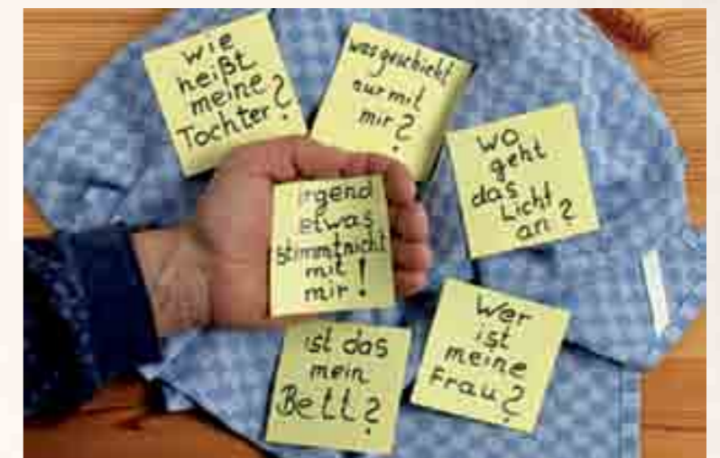
Demenz stellt das Leben der Betroffenen und ihres Umfeldes auf den Kopf. Der Informationsabend für pflegende Angehörige findet am 16. März 2018 in Saas-Grund statt.

Inhalt: Beratung in der Bewältigung des Alltages Information über Entlastungsdienste Aufklärung über finanzielle und rechtliche Aspekte