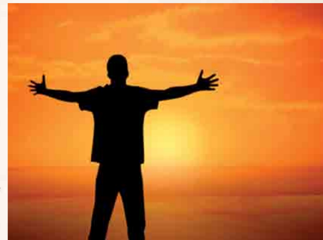
Wellness für die Seele ist ebenso wichtig ist wie die für den Körper.