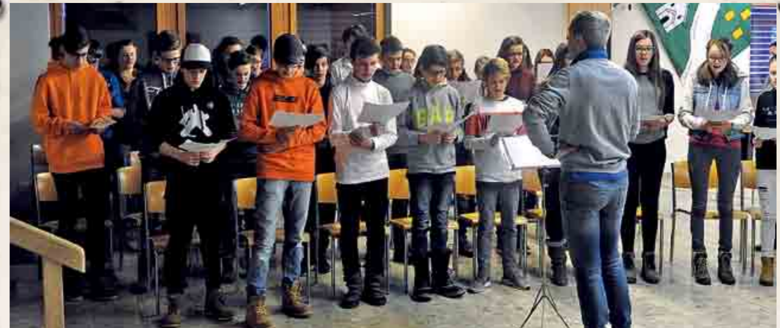
Gesang, der begeistert: Der Chor hat verschiedene Songs unterschiedlicher Musikrichtungen einstudiert.