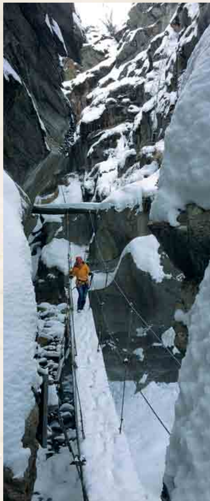
Winterliches Erlebnis: Durch die Feeschlucht bei Eis und Schnee.

Der spektakuläre Klettersteig durch die Feeschlucht ist ganzjährig ein unvergessliches Erlebnis. Als nächtliche Tour steht der besondere Weg von Saas-Fee nach Saas-Grund hingegen nur im Winter auf dem Programm.